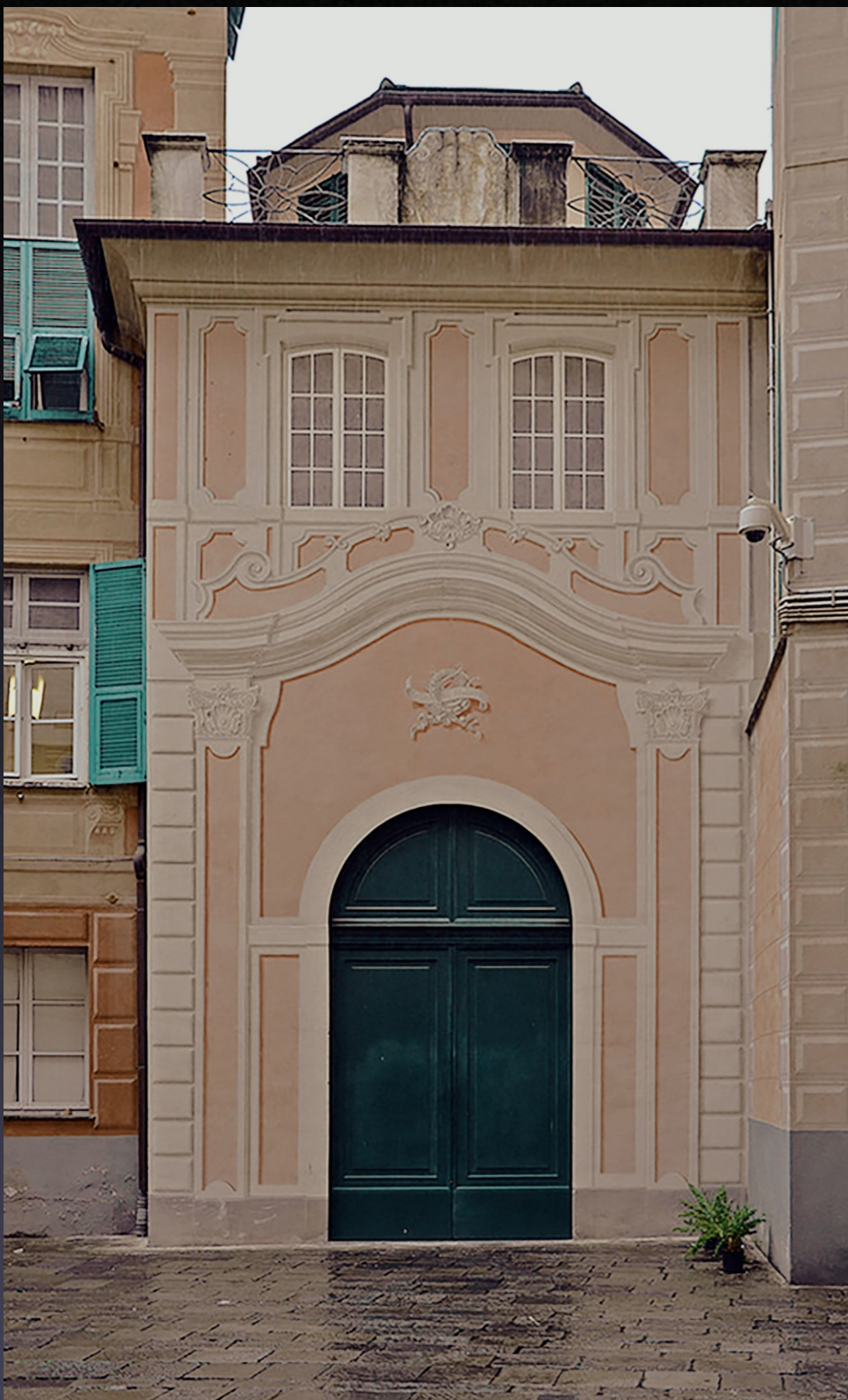
L'ingresso del Teatro del Falcone Presso il Museo di Palazzo Reale di Genova