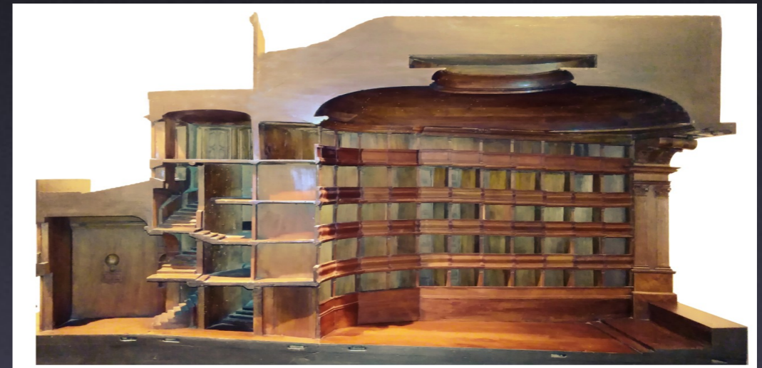
Modellino del Teatro del Falcone dei primi del novecento