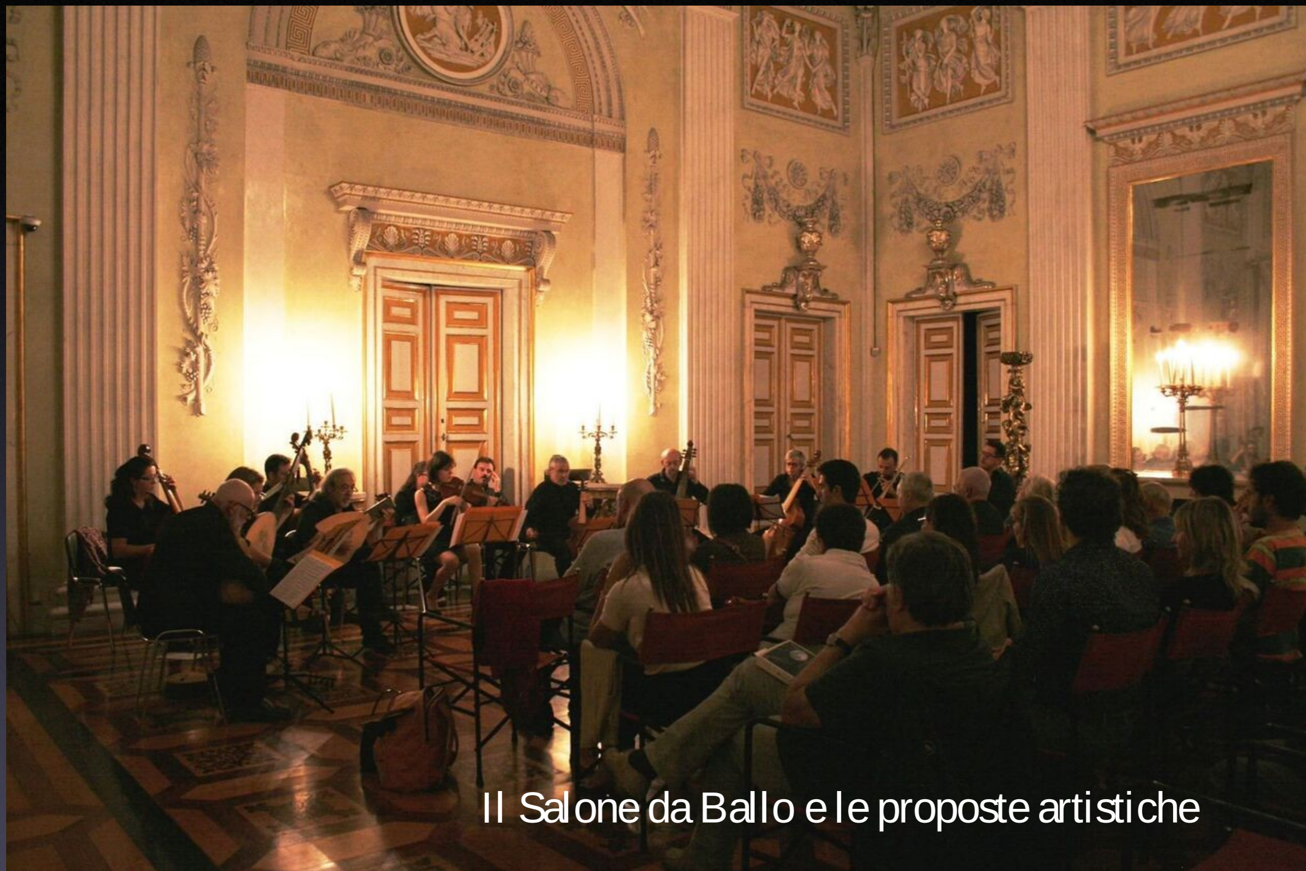
Il Salone da Ballo e le proposte artistiche