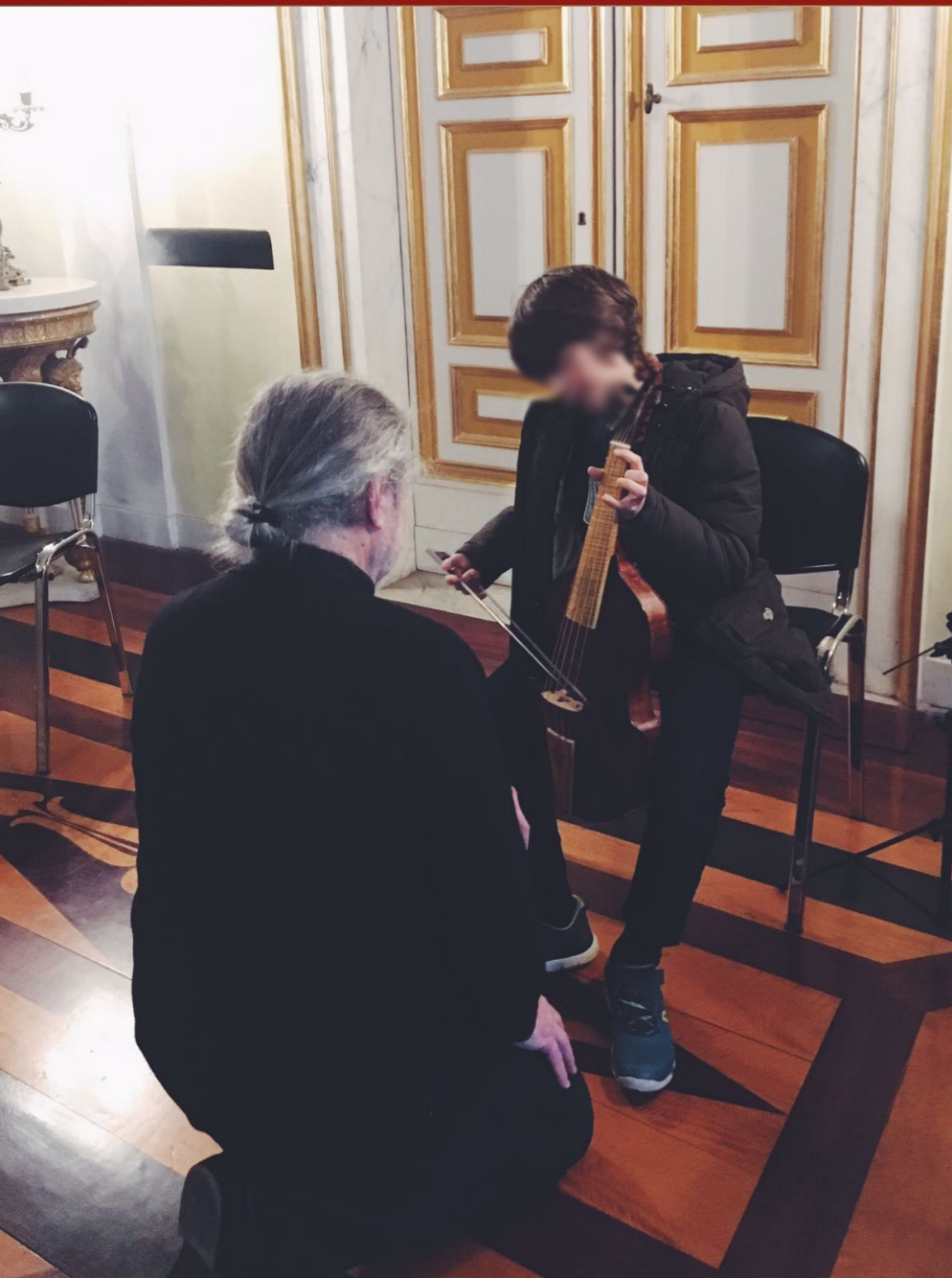
Salone da Ballo del Museo di Palazzo Reale